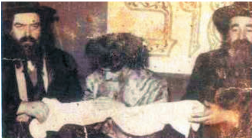
אינדערהיים אין רומעניען מיטן סקולענער רבין ז"ל, און הגה"צ מטשעקא ז"ל

איינמאל האט אים דער אראדער רב געזאגט ער זאל זיך מקבל זיין צו וואשן יעדע וואך צו מלוה מלכה, און דאס וועט העלפן צו זיין ישועה, און האט אים געזאגט: איך בין דיר מבטיח מיטן כח התורה זאלסט געהאלפן ווערן, וכך הוה ב"ה.